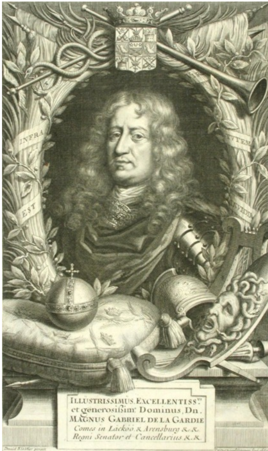
Kansallisgalleria, kuparikaiverus 1600 -luvulta

Magnus De la Gardie ja virren 605 taustaa